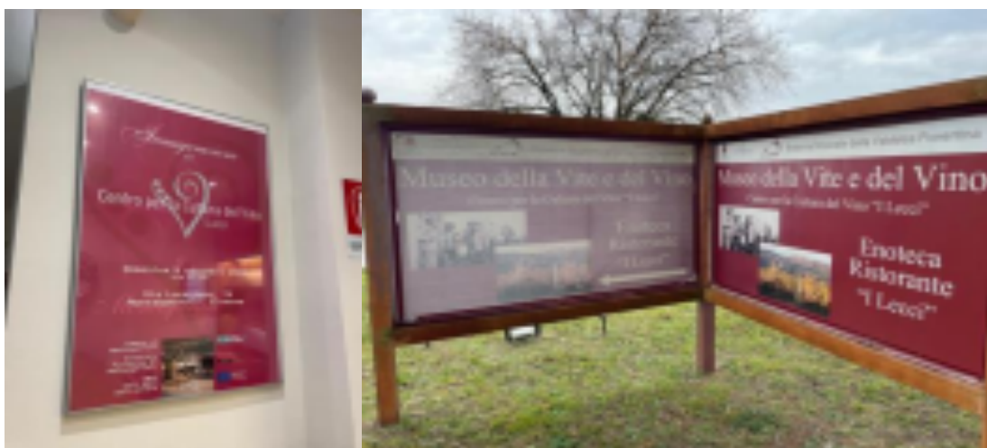
Pannelli esterni del museo originale I Lecci “Centro per la cultura del vino” e manifesto dell’inaugurazione (2003)

Lo sguardo e metodo antropologico permette qui di studiare fenomeni e luoghi vicini al quotidiano, per indagare le scelte profonde, il perché della loro esistenza. Il museo scelto diventa quindi oggetto e soggetto di esperienza e interpretazione (Lattanzi, 2021). La conoscenza locale della fusione fra comunità, patrimonio culturale e territorio è oggetto di indagine e protagonista del museo stesso.