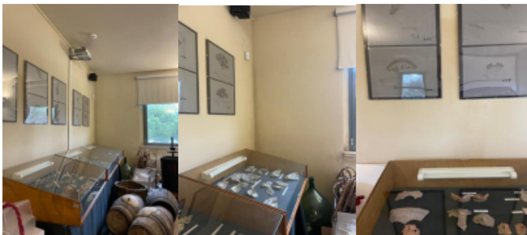
Sala in allestimento, reperti ceramici e botti di vino del precedente museo