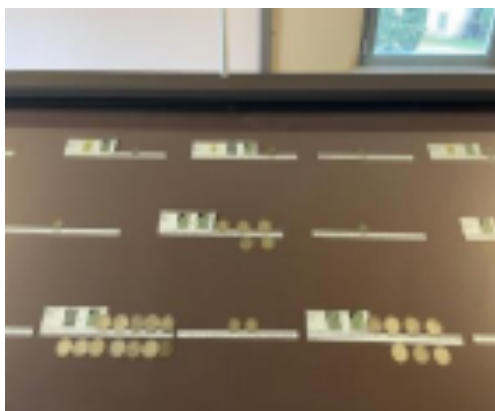
Monete rinvenute nel tesoro di Tresanti, in riallestimento