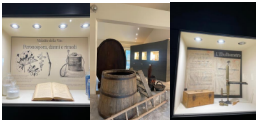
Pannelli espositivi e manufatti sulla cultura del vino. Gli oggetti mutano e sono dinamici, raccontano storie: museo come liberazione o divisione?

Per concludere, la parola eco deriva dal greco OIKOS, significante casa, ambiente (Ecomuseo Digitale Terre di Siena 2023). La connessione fra culture, radici, comunità, territorio sono tuttora più che necessarie, nel ristabilire connessioni intersezionali e durature, di fronte alla de-localizzazione e perdita di radicamento contemporanea, nel frutto dello sviluppo capitalista e delle derivanti crisi socio-ecologiche. Gli ecomusei possono essere una radicale soluzione al ripensamento della cultura come motore di cambiamento, l'educazione e democrazia come pilastri e la comunità al centro. Il museo fissa il germe della località, evoluzione, rapporti di cambiamenti. Il prendersi cura, responsabilità, collaborazione e partecipazione sono fondamentali nella creazione di una (più) critica antropologia museale e approccio antropologico ai musei e luoghi di cultura. La chiave (forse) dell'antropologia sta nel rivedere la (ri)connessione piuttosto che l'evoluzione lineare come pilastro delle comunità e delle culture. Il museo è essenziale in questa definizione. Il museo non è solo confronto con il diverso, l'alterità, ma soprattutto con sé e la comunità ecologica e sociale prossima, una riscoperta relazionale, invisibile e percettibile. La quotidianità delle tradizioni e del territorio sono i nuovi protagonisti, il museo diventa "museo dei mondi possibili" per una fruizione democratica (Lattanzi 2021, p.148).